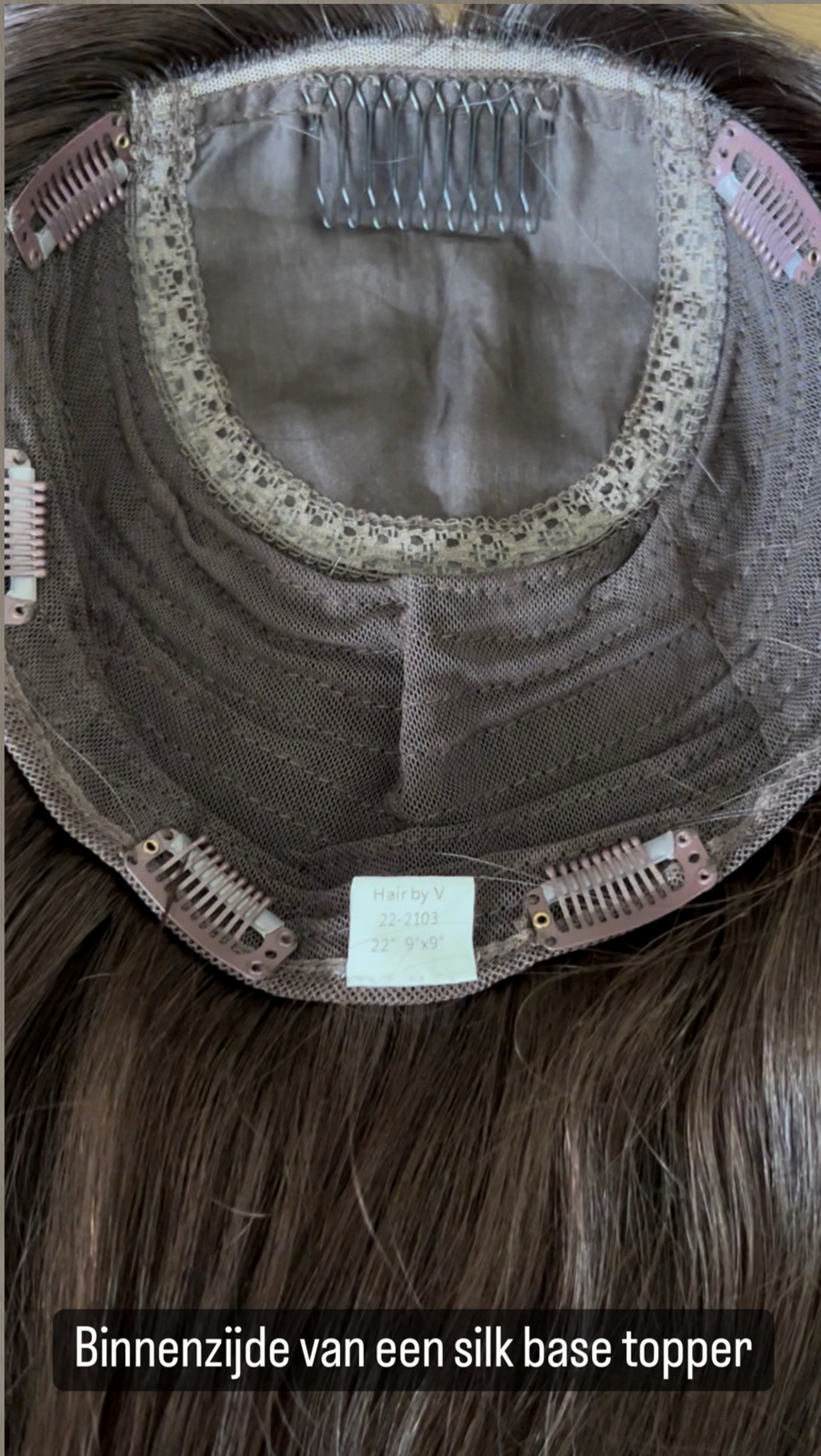
Binnenzijde van een silk base topper